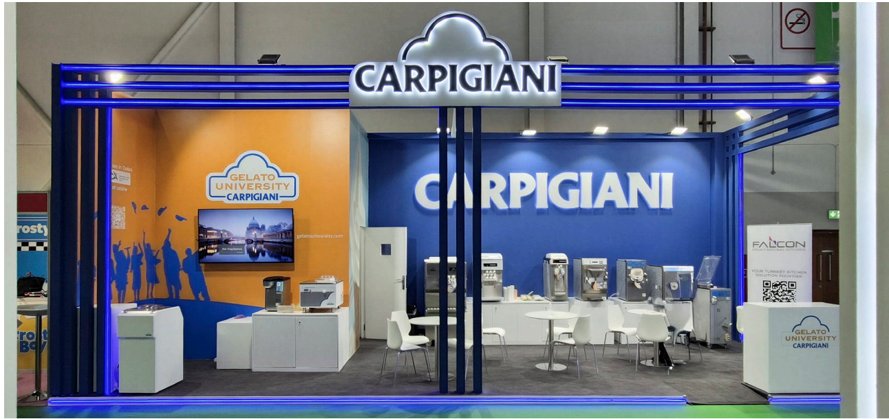
Gulfood Dubai 2026