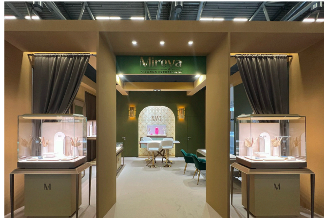
Inhorgenta Monaco 2025