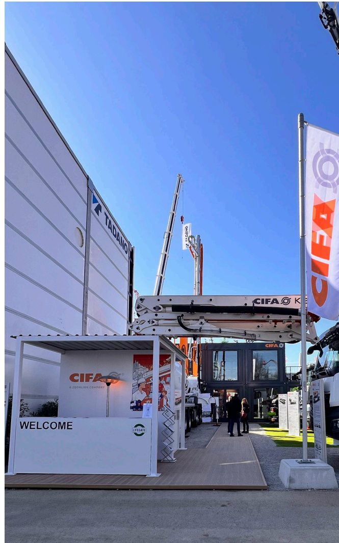
BAUMA Monaco 2025