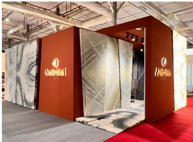
Big5 Saudi 2026