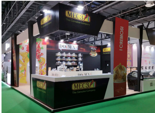
Gulfood Dubai 2026